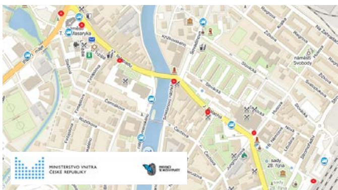
Mapa umístění kamerových bodů, u kterých proběhla modernizace.

V druhé polovině roku 2019 došlo k plánované modernizaci stávajícího městského kamerového dohlížecího systému. Cílem projektu bylo pořízení a umístění sedmi nových kamer. Původní kamery se pořizovaly již v roce 2012 a byly tři roky za hranici své životnosti. V případě závady na některé z nich už by oprava nebyla možná z důvodu zastaralé technologie. Výměnou kamer došlo k technologické modernizaci